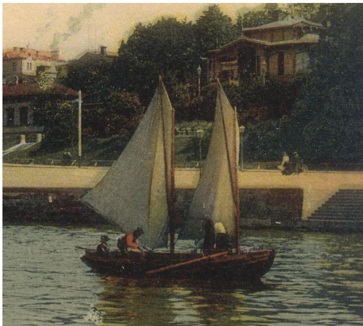
Talonpoikaisvene lähdössä kotimatalle Aurajoessa

Tuuli on vanha ja edullinen voimavara. Purjehtiminen on vanha ja hyvä kulkemistapa merellä. Ovathan velkualaiset purjehtineet paljon aina kaukomaille asti talonpoikaispurjehduskauden aikana. Myös näissä Turun-matkoissa käytettiin paljon purjeita, seilattiin kuten sanottiin. Saaristossa kehittyikin tähän tarkoitukseen sopiva purjepaatti. Se kulki LUUPPI -nimellä.