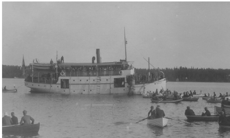
s/s Koli Naantalissa

Luuppi oli talon ylpeys. Viimeiset luupit Velkuassa tiettävästi ovat olleet Haukalla ja Kettumaassa. Nekin hävisivät 1920-luvun alussa.