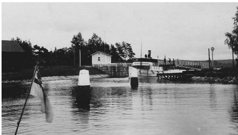
s/s Mauritz Holmberg, taustalla luotsitupa

Kemiön saaren ja Perniön välisen salmen kapeimman kohdan nimi on Strömman. Se oli ennen niin karikkoinen ja matala paikka, että Strömman pohjoispuolella olevaan Teijon ruukkiin kulkevat malmilaivat joutuivat kiertämään koko suuren Kemiön saaren päästääkseen purkamaan lastinsa Teijossa. Tämä rautamalmi oli louhittu vain noin 10 km Strömmasta etelään Kiskonjoen varrelta!