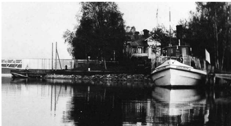
s/s Angelniemi Strömman laiturissa, taustalla kanavanvartijantalo

1960-luvulla tuli taas tarve suurentaa kanavaa, koska entistä suurempia rahtilaivoja ryhdyttiin rakentamaan ja romuttamaan Teijossa että Mathildedalissa. Päätettiin rakentaa kokonaan uusi kanava salmessa olevan Strömman saaren toiselle puolelle. Uudesta kanavasta tuli 28 m leveä ja 5,5 m syvä. Vanhan kanavan kääntösillasta tehtiin kiinteä ja uuden kanavan yli rakennettiin vieläkin toimiva sähköinen läppäsilta. Uusi kanava otettiin käyttöön 1968.