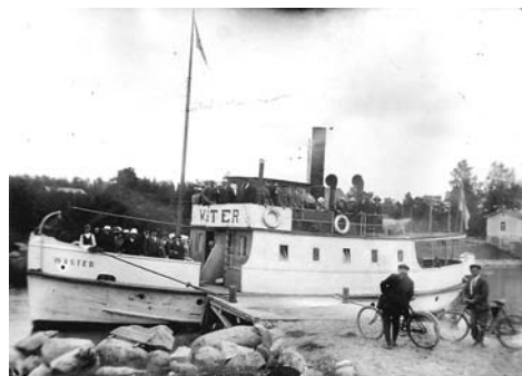
Saaristohöyryt Ilma ja Wäster Strömmassa

Vanha kanava riitti puolen vuosisadan ajan merenkulun tarpeisiin, kunnes 1896 aloitettiin kanavan parannustyöt. Nyt sen leveydeksi tuli 16,7 m ja syvyydeksi 4 m. Vanha rullasilta korvattiin kääntösillalla, jonka kanavanvartija käänsi veivillä sivuun väylän päältä. Vieläkin paikalla oleva kanavanvartijantalo on rakennettu 1897.