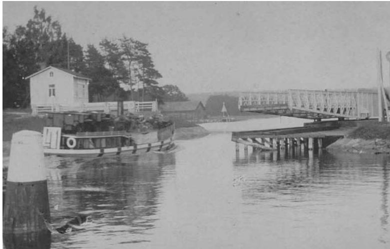
Höyryluoppi maalattuna I maailmansodan tunnuksilla

1960-luvulla tuli taas tarve suurentaa kanavaa, koska entistä suurempia rahtilaivoja ryhdyttiin rakentamaan ja romuttamaan Teijossa että Mathildedalissa. Päätettiin rakentaa kokonaan uusi kanava salmessa olevan Strömman saaren toiselle puolelle. Uudesta kanavasta tuli 28 m leveä ja 5,5 m syvä. Vanhan kanavan kääntösillasta tehtiin kiinteä ja uuden kanavan yli rakennettiin vieläkin toimiva sähköinen läppäsilta. Uusi kanava otettiin käyttöön 1968.